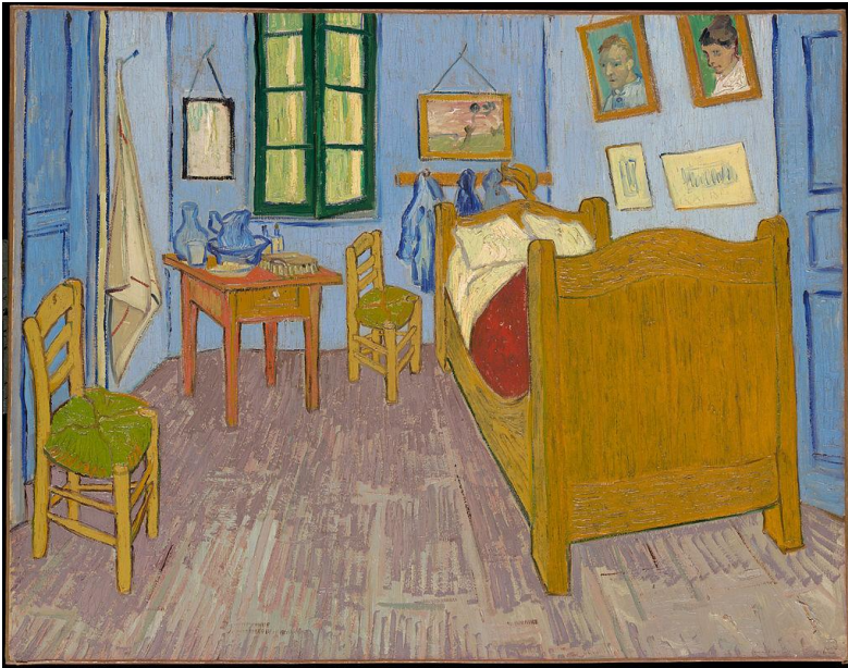
La Chambre à coucher [troisième version] (1889) – Vincent van Gogh

Vincent Van Gogh n'a pas connu une vie très heureuse. Son travail artistique n'a pas été reconnu de son vivant. Il a par ailleurs souvent vécu dans la solitude, et été rejeté par la plupart des gens, à l'exception de son frère Théo, qui le soutenait beaucoup. Ils ont d'ailleurs échangé de nombreuses lettres, dont environ 600 ont été publiées. Van Gogh souffrait également de problèmes de santé : il consommait beaucoup d'alcool et était traversé par des troubles mentaux importants, surtout dans les dernières années de sa vie. C'est lors d'une crise de délire et d'angoisse, après une dispute avec le peintre Paul Gauguin, qu'il s'est coupé l'oreille. Le 27 juillet 1890, Vincent van Gogh, alors âgé de 37 ans, est grièvement blessé d'une balle dans l'abdomen à Auvers-sur-Oise. Il meurt. Deux jours plus tard, il meurt, emportant avec lui le secret de ce coup fatal. L'histoire officielle rapporte que c'était un suicide.