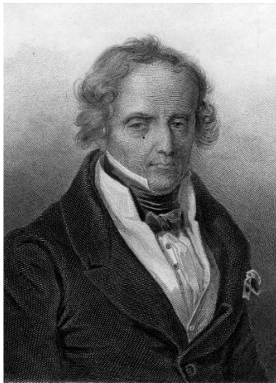
Xavier de Maistre (1763-1852)

Objectifs : Connaître l'auteur Xavier de Maistre et situer son œuvre ; comprendre l'enjeu du récit Voyage autour de ma chambre .