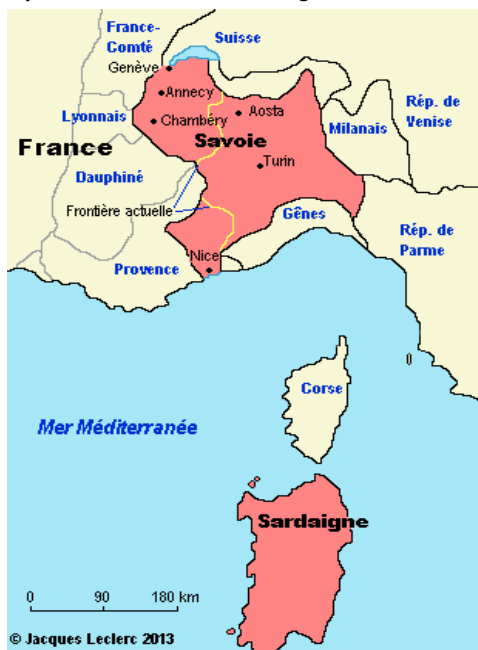
Royaume de Savoie et de Sardaigne au XVIII e siècle

*À la fin du XVIII e siècle, la Savoie ne faisait pas encore partie de la France. Elle appartenait alors au royaume de Piémont-Sardaigne, dont la capitale était Turin, en Italie du Nord. Ce royaume regroupait : la Sardaigne (île méditerranéenne), le Piémont (région autour de Turin) et la Savoie (région montagneuse de langue française). Les deux frères de Maistre (Joseph et Xavier) étaient donc Savoisiens mais sujets du roi de Sardaigne, c'est-à-dire des sujets italiens d'un point de vue politique.